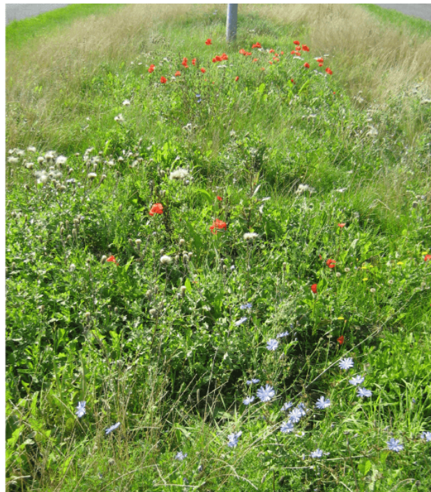
Figur 1. Midterrabbatter i Lautrupparken i Ballerup før (tv.) og efter (th.) harvningsforsøg. Det tager et par måneder for de fremspirede blomsterplanter at vokse sig store, men et halvt år efter harvning dominerer de over græsserne.